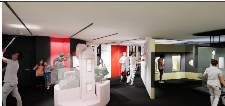
6_Der virtuelle Rundgang: Blick in die Themenräume