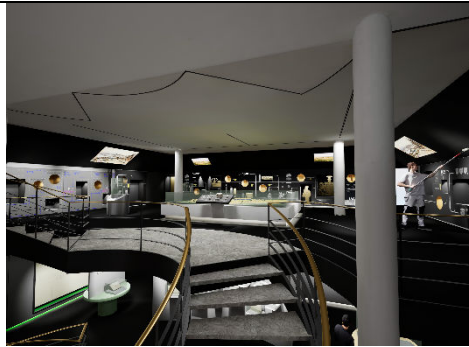
2_Der virtuelle Rundgang: Über die Treppe in den ersten Ausstellungsraum („Auftrakraum“)