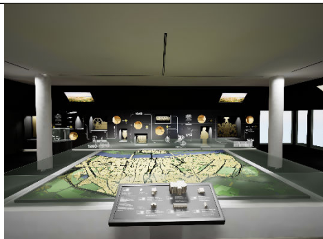
4_Der virtuelle Rundgang: Der „Auftrakraum“ mit dem historischen Stadtmodell und anderen Highlight-Exponaten