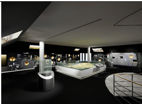
3_Der virtuelle Rundgang: Der „Auftrakraum“ mit dem historischen Stadtmodell und anderen Highlight-Exponaten