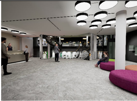
1_Der virtuelle Rundgang: Startpunkt Foyer (alle Abbildungen: Screenshots VR-Anwendung)